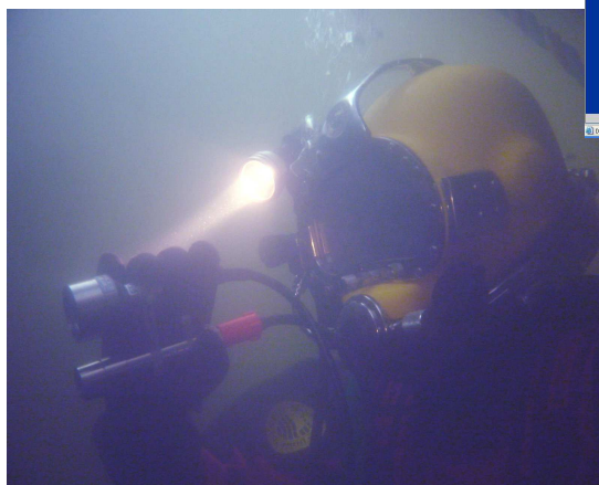
Duiker met onderwater videocamera.